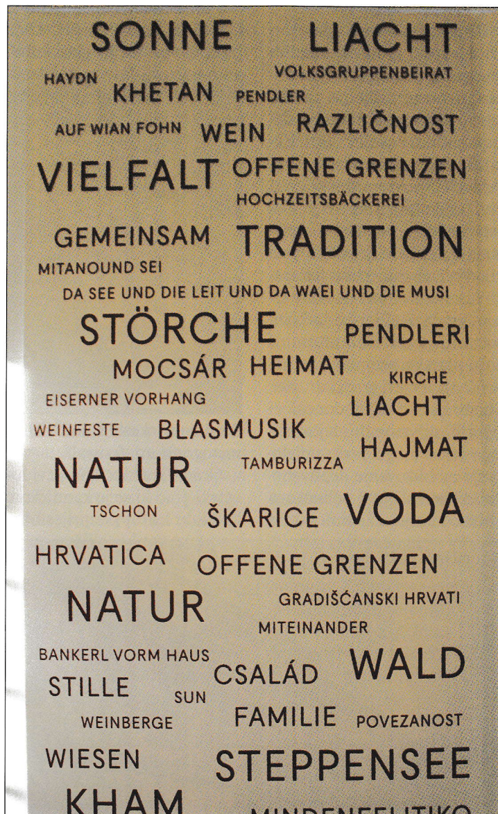
Jedna od pločov s navodno „tipičnimi“ riči na četiri jezici u Gradišću, na hrvatskom, mađarskom, nimškom i roman u izložbi u Solunku

Osobno sam se jako veselio svakomu odzivu, primjedbi dopuni, kritiki, nezadovoljstvu na seriju. Akoprem sam si čudakrat mislio da to nije moguće, da su svi ki su (morebit) čitali seriju sporazumni s tim što sam pisao. Otvoreniju diskusiju sam si očekivao u korist našega naroda. Toliko svega lipoga ali i tužnoga sam mogao zviditi u pisanju doprinosov (ke druge narodnosti ne spominjaju).