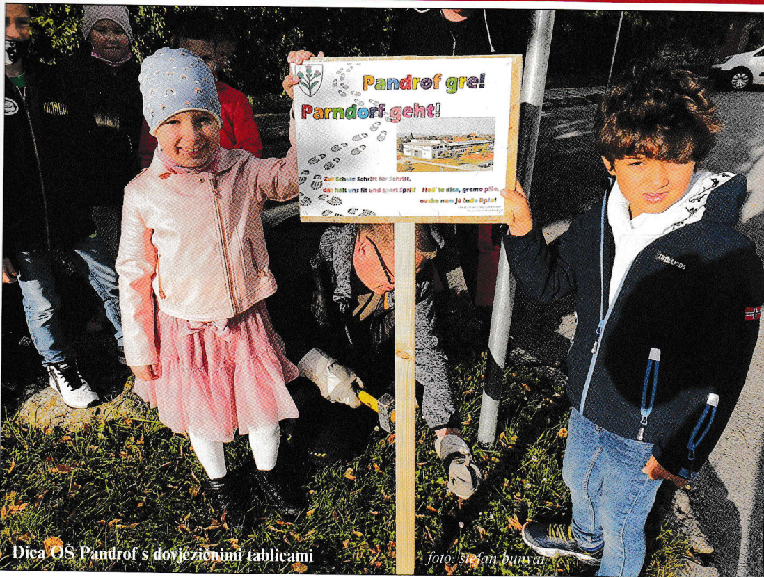
Dica OS Pandrof s dovezionim tablicami