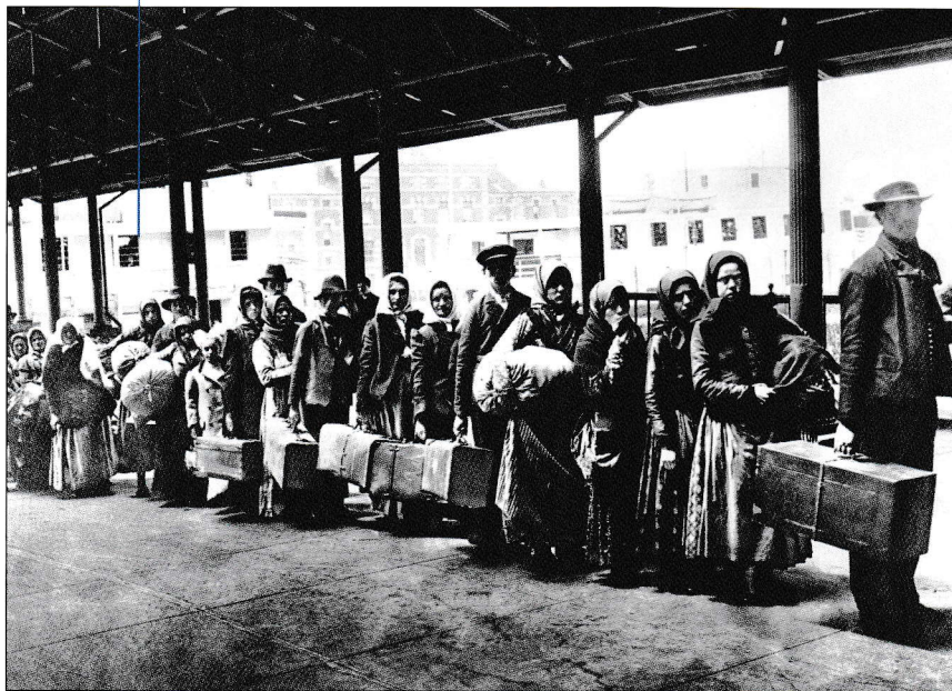
Useljenici u redu kada ostavljaju Ellis Island čekajući trajekt do N.Y. foto: oko 1900.