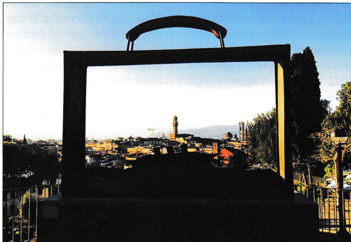
Firenca: spomenik iseljenikom: Jean-Michel Folon, Partir , 1977.

mi kritizirao. U našoj krajini skoro nije bilo nikakove industrije kade bi se ljudi mogli biti zaposliti a razvitak mobilizacije im je nudio mogućnost u prikmorje. Na sve to su došle i političke krize. Revolucija 1848. ljeta, pak krize 1919.-1921. ljeta po Prvom svitskom boju, gospodarstvena kriza 1929. ljeta, Hitlerov režim 1938. ljeta, nestrpljenje političkih ideologijov po 1945. lj, kot i revolucija u Madjarskoj 1956. ljeta i krize u istočnom bloku. Svaka kriza je tirala i Hrvate van iz ovoga prostora.