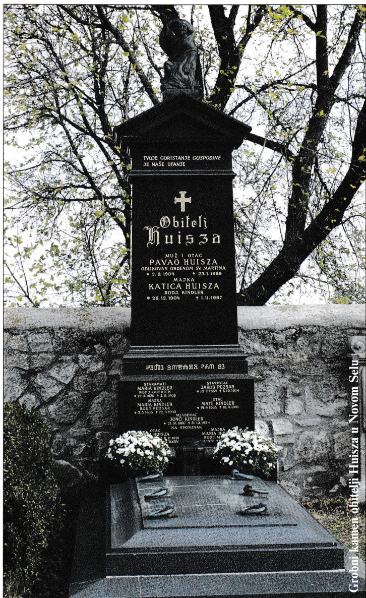
Grobni kamen obitelji Huisza u Novom Selu

Károly Gaál i publicirali u knjigi »Totenklage und Erzählkultur in Stinatz« (1987.). Ali tim je nekadašnja općeprihvaćena tajnovitost postala javna o koj se (ne) smi istotako kako do tada pisati, raspravljati. A kakova je to navada? Tajnovita i specifična, samo za uži krug rodbine. Zato je ostala tako dugo zatajena, nepoznata i neprihvaćena u istraživanju narodnoga života (etnografije).