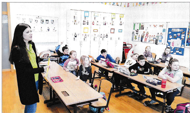
Podučavanje u OŠ Nova Gora (vidi str. 23).