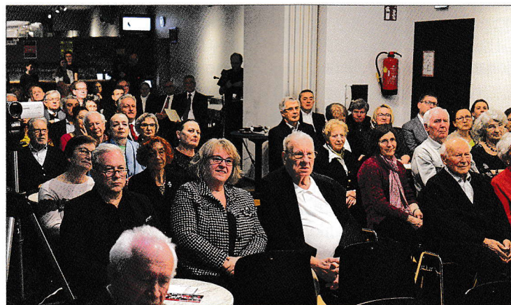
Puna mala dvorana u Kugi tokom predavanj 18. marca.

A o Šlabikari se govori i u predgovoru k Horvatszkom katekizmu iz 1747. ljeta. A ka namjera stoji za ovim: opismenit hrvatski narod ovde u dijaspori, da bi mogao čim prije štati molitvenike, katekizmuše i