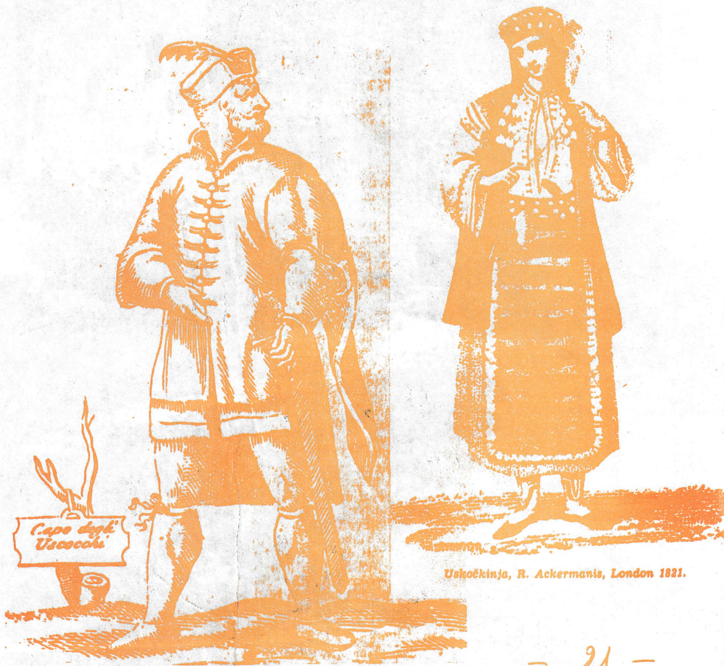
Uskočki vojvoda, bakrorez iz 17. st.