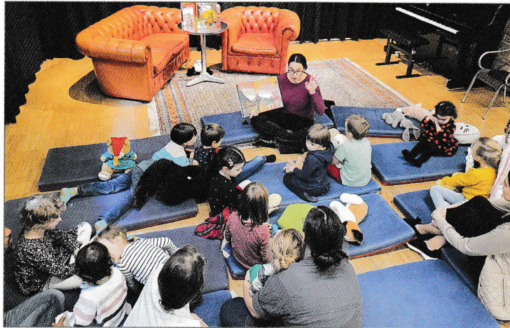
Centar.dica.čitaonica subotu dopodne.

Povodom ljetosnjega tematskoga tajejna „Österreich liest/ Austrija čita“ održala se prošlu subotu, 21. oktobra još jedna centar.dica.čitaonica, pri koj su roditelji i učiteljice Jezične hiže čitali različne slikovnice za djecu, med ostalim i Maloga vrtljara, Vjeverice svadalice i Kako živi Antuntun. Za muzičku pratnju je bio zadužen Filip Tyran. Čitaonicu su organizirali roditelji dvojezične dičje grupe Viverica, ka ljetos obilježava 30. jubilej postojanja. Kao i prošlih ljet čitaonica je i ovo ljeto bila dobro poiskana, ter su u njoj uživali ne samo mali, nego i veliki.