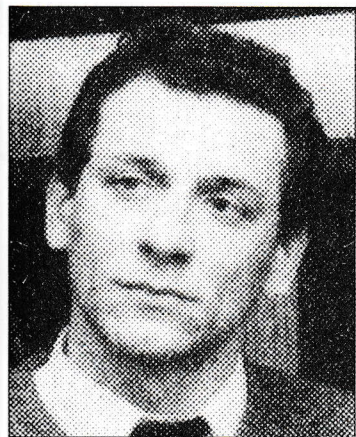
Fotografija uz „Moje mišljenje“ 20.1.1984.-15.3.1985. //