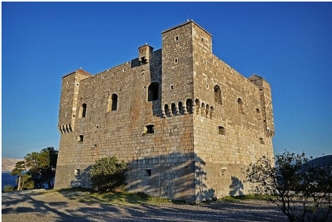
slika: Senjska utvrda Nehaj

https://de.wikipedia.org/wiki/Festung_Nehaj