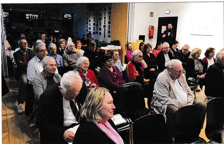
Puna mala dvorana je slušala literaturu i muziku.

Po priredbi su gosti imali mogućnost kupiti knjige Hrvatskoga štamparskoga društva odnosno autoric i u dobrom raspoloženju po jako ugodnom otpodnevnu su brojni gosti koristili priliku za razgovor s umjetniki.