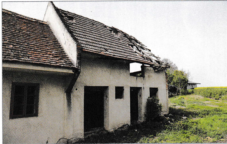
Prvi dio će ostati stati, zadnji dio će se srušiti i tamo će dojtj med drugim dvorana za priredbe i sjednice.

Velikina ove dvorane odvisi samo od financijskih sredstav, tako arhitekt Rudi Sedenik, komu kot Maloborištofcu čuda na tom leži, da se ov stan obdrži u ovom obliku. On kaže situaciju