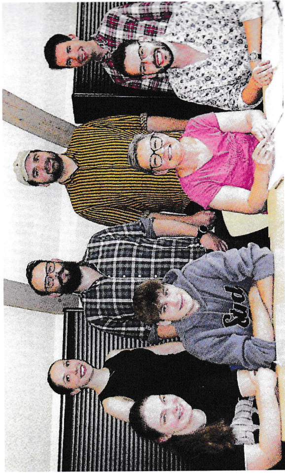
Igrokazačko društvo "Dugava"

Na samom kraju, mogli bismo pretpostaviti da su protagonisti naše pripovijetke svojim potomcima začetnici odnosno pokretači te sustvoritelji u pogledu kulturnih zbivanja u Pinkovcu.