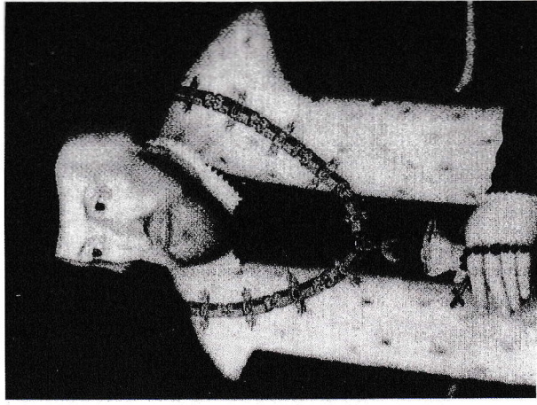
I. Ferdinánd király. König Ferdinand I., Herrscher zur Zeit der Kroatenansiedlung.