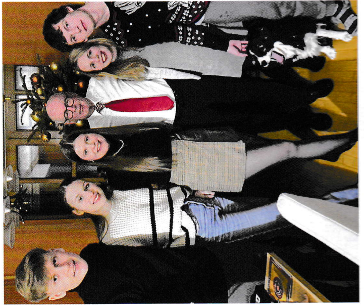
Tizian - Naya - Mavie - dida - Cora - Jaša - kuja - Nika